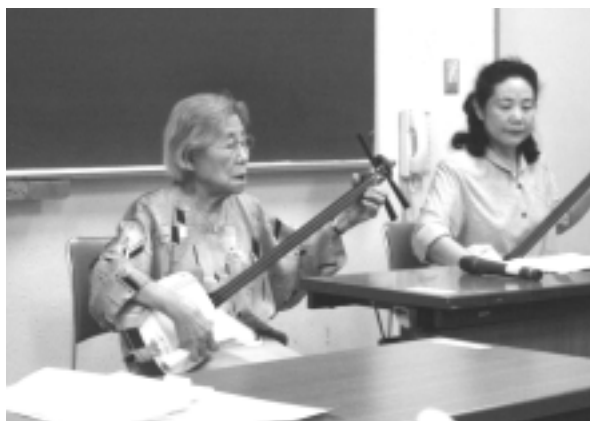
日本を代表した三味線演奏

料理と音楽を通して「心の交流」こんな世界に戦争なんて考えられません。 ほんとに“世界はひとつ”です。(記：皆川 喜美代)