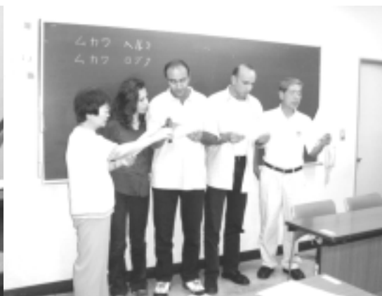
結婚を祝って 世界は二人のために